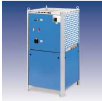
VWK/1 - Kühlwasser-Rückkühler mit einer Kühlleistung von 2 bis 70 kW mit Tank und Pumpe. Kompaktbauweise mit hoher Temperaturgenauigkeit.