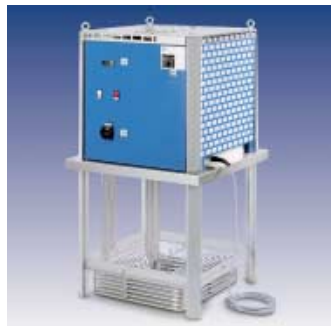
TRK - Eintauch-Rückkühler für Kühlschmierstoffe mit einer Kühlleistung von 2 bis 75 kW. Servicefreundlich in Wartung und Reinigung.

Neben unserer Standard-Produktpalette bieten wir Ihnen Lösungen zur Flüssigkeitsrückkühlung in allen Industrieanwendungen.