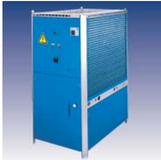
SVK - Kühlwasser-Rückkühler mit einer Kühlleistung von 15 bis 70 kW mit Tank und Pumpe. Kompaktbauweise mit hoher Temperaturgenauigkeit.