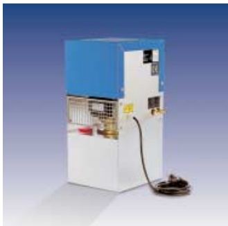
LWK - Luft-Wasser-Kühler ohne Kälteaggregat mit einer Kühlleistung von 2 oder 2,5 kW mit Tank und Pumpe. Die preiswerte Alternative für Anwendungen mit höheren Wassertemperaturen.